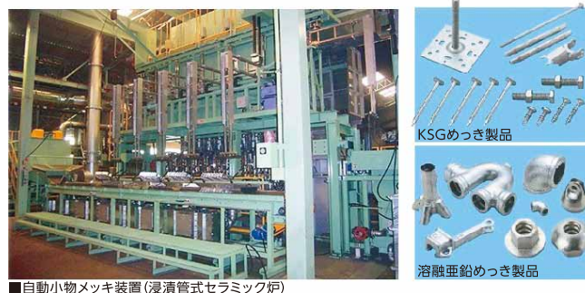
■ 自動小物メッキ装置(浸漬管式セラミック炉)